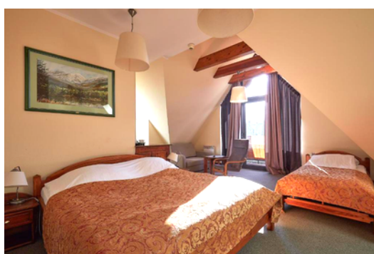
Przykładowe zdjęcia hotelu.